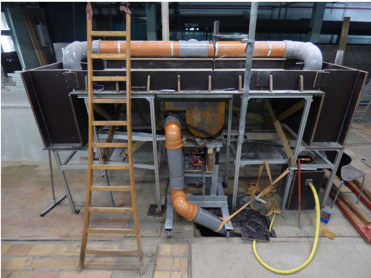
Photo 1 – Vue de face de la configuration d'essai (avaloir en fonte).