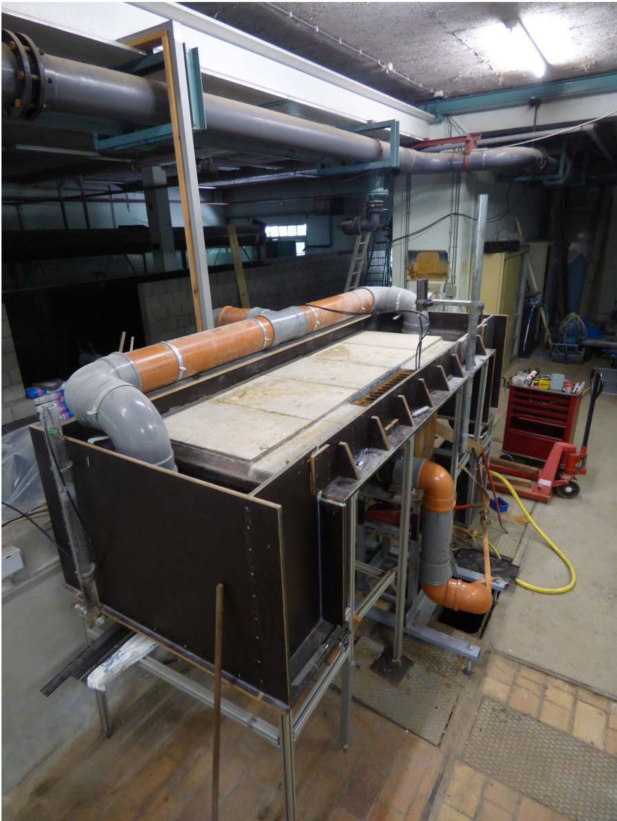
Photo 2 – Vue du dessus et du côté de la configuration (avaloir en fonte).